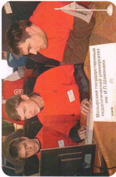
Студенты факультета на олимпиаде по программированию