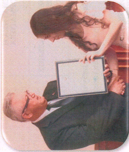
Министр образования Республики Беларусь Карпенко И.В. вручает грамоту студентке факультета

ПРИГЛАШАЕМ НА ФИЗИКО-ИНЖЕНЕРНЫЙ ФАКУЛЬТЕТ!